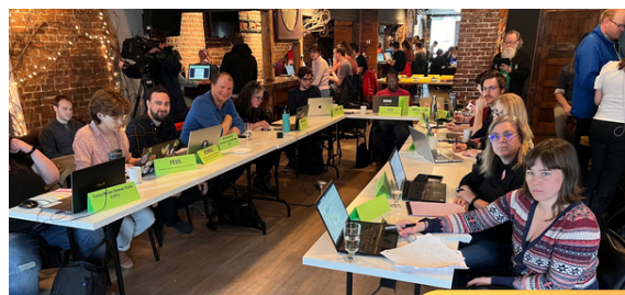
Soirée écoute collective Budget provincial 21 mars