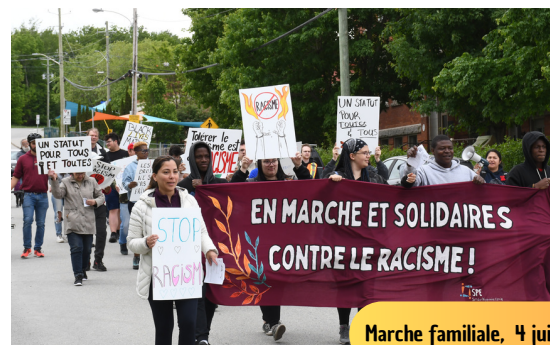
Marche familiale, 4 juin