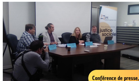
Conférence de presse, 13 mai