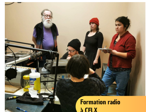
Formation radio à CFLX