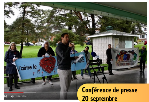
Conférence de presse 20 septembre