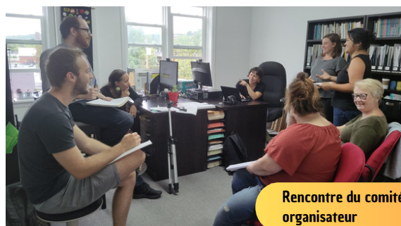
Rencontre du comité organisateur

SPE a collaboré avec l'APTS-Estrie pour l'organisation d'un débat électoral avec les personnes candidates sur le thème de la santé et des services sociaux.