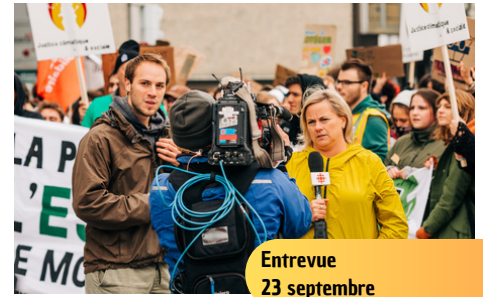
Entrevue 23 septembre