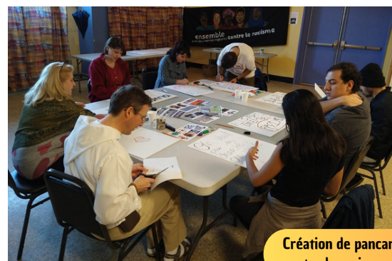
Création de pancartes contre le racisme