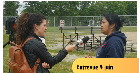
Entrevue 4 juin