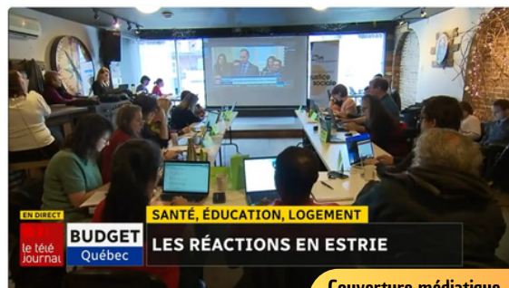
Couverture médiatique Écoute collective 2023