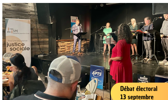
Débat électoral 13 septembre